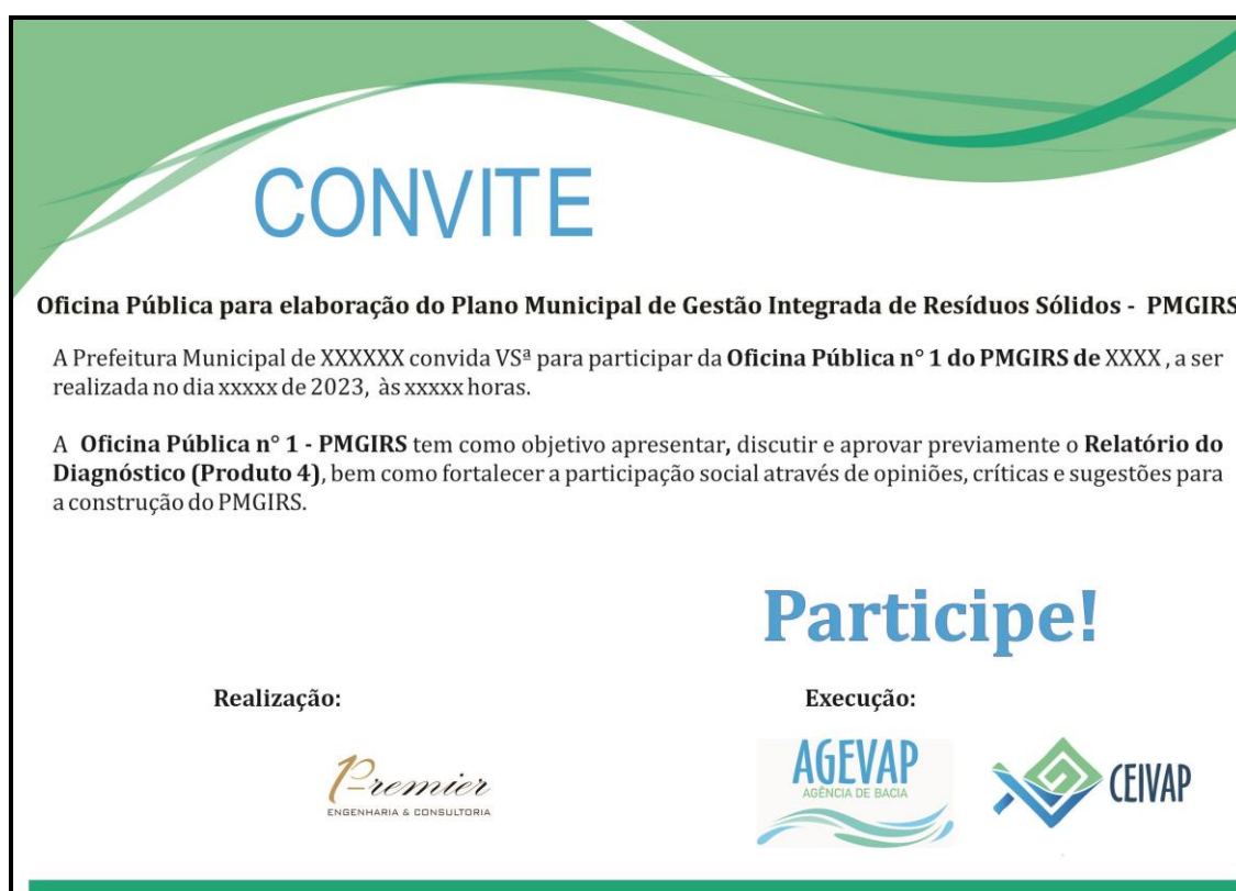
Figura 4 – Modelo de convite para os eventos

A seguir é apresentado um modelo de convite.